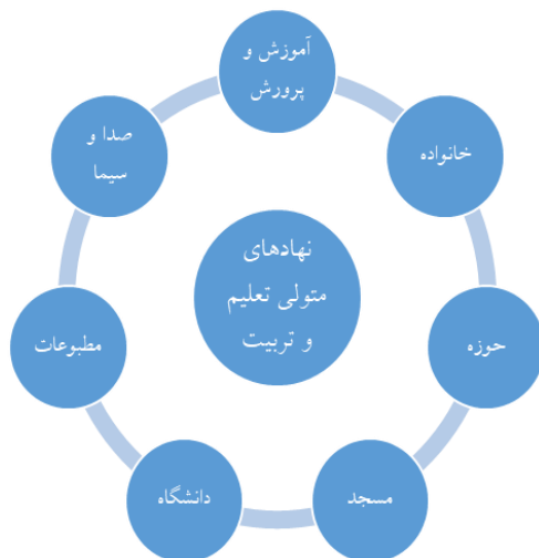
تصویر ۶- نهادهای متولی تعلیم و تربیت