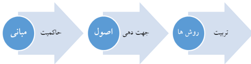
تصویر ۱- ارتباط بین مبانی، اصول و روش‌های تربیت

در نهایت باید گفت که مبانی پایه و اساس استخراج و استنباط اصول تربیتی است و این اصول تربیتی هستند که جهت‌دهنده و تعیین‌کننده روش‌های تربیتی هستند.